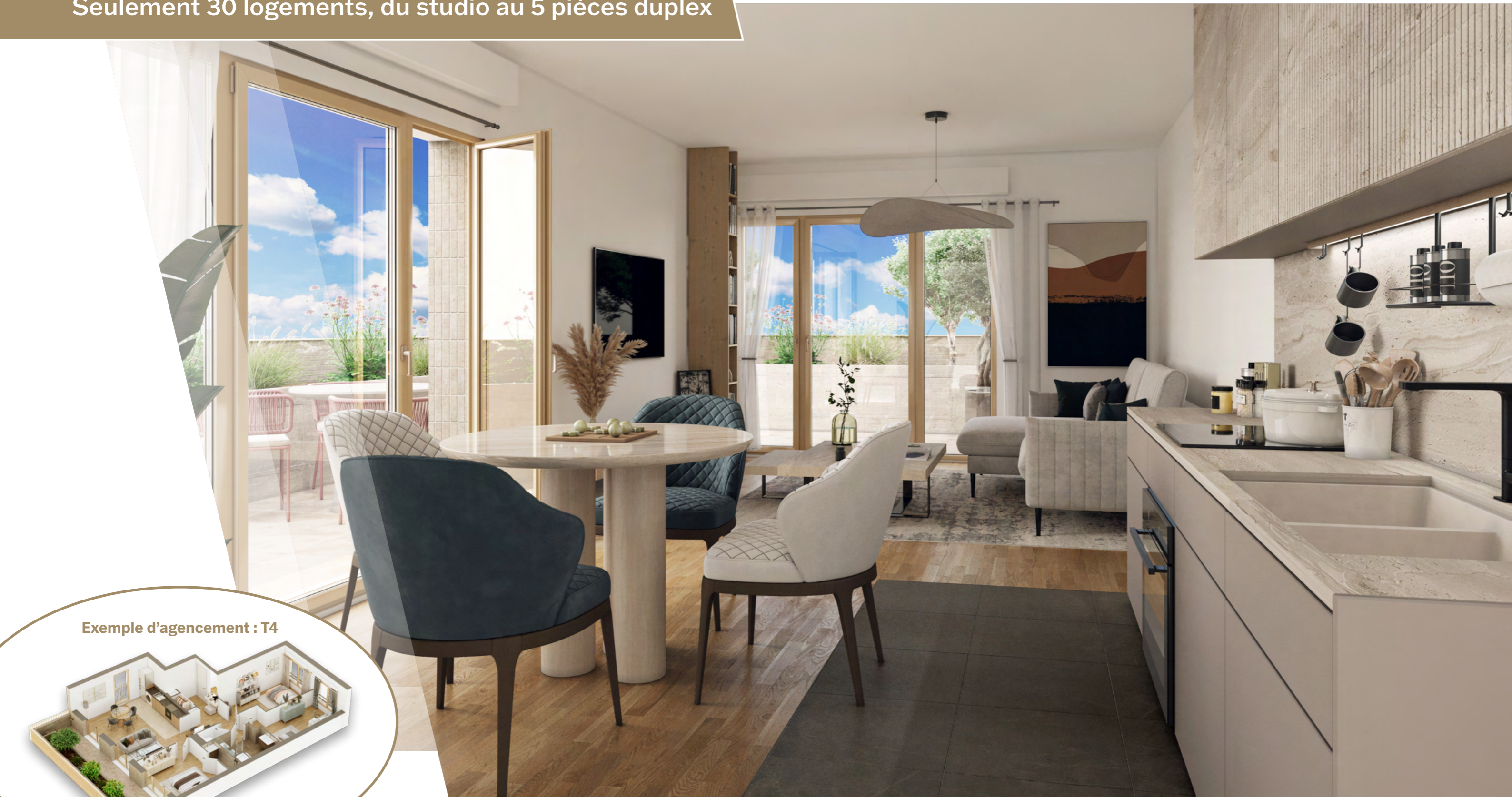
Exemple d'agencement : T4

Seulement 30 logements, du studio au 5 pièces duplex