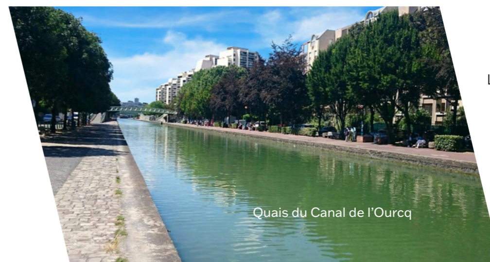
Quais du Canal de l'Ourcq

La Gare RER, située à proximité de la mairie, ainsi que la ligne de métro, rendent aisément accessibles tous les équipements publics, et de nombreux lieux de découvertes. À deux pas du Parc de la Villette, de la Philharmonie de Paris et de la Cité des Sciences & de l'Industrie, l'offre culturelle et de loisirs est particulièrement riche. Grâce à cette localisation stratégique, la ville allie accessibilité, dynamisme urbain et qualité de vie aux portes de Paris.